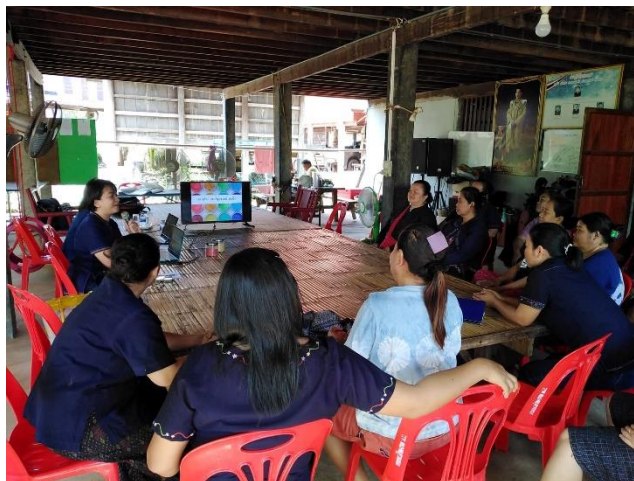
ภาพที่ 7 อบรมให้ความรู้ด้านการผลิตและการตลาดอย่างยั่งยืน

ในรูปแบบของ 4 P คือ Product Price Place และ Promotion ให้กับกลุ่มวิสาหกิจชุมชน ที่ตั้งใหม่ คือ วิสาหกิจชุมชนกลุ่มสตรีทอผ้าพื้นเมืองแพรวบ้านจ่าน ส่งผลให้ชุมชนมีแนวทางในการดำเนินงานที่ชัดเจนมากขึ้น