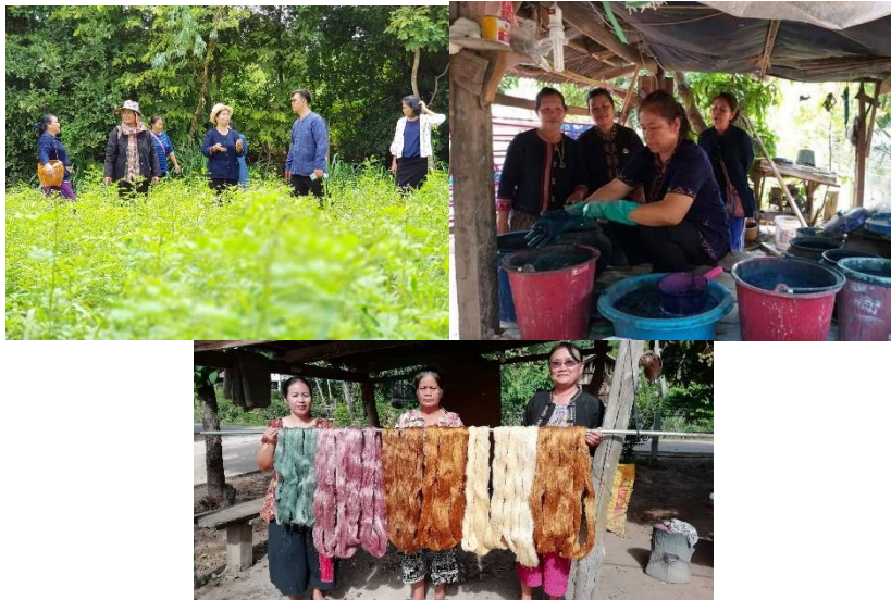
ภาพที่ 8 การส่งเสริมการใช้สีธรรมชาติทดแทนสารเคมี

การยกระดับผลิตภัณฑ์ และเพื่อสุขภาพของผู้ผลิต ผู้บริโภค รวมทั้งเป็นมิตรต่อสิ่งแวดล้อม ส่งผลให้ทุกกลุ่มหันกลับมาทำวัสดุธรรมชาติมาใช้ในการสร้างผลิตภัณฑ์ประเภทผ้า