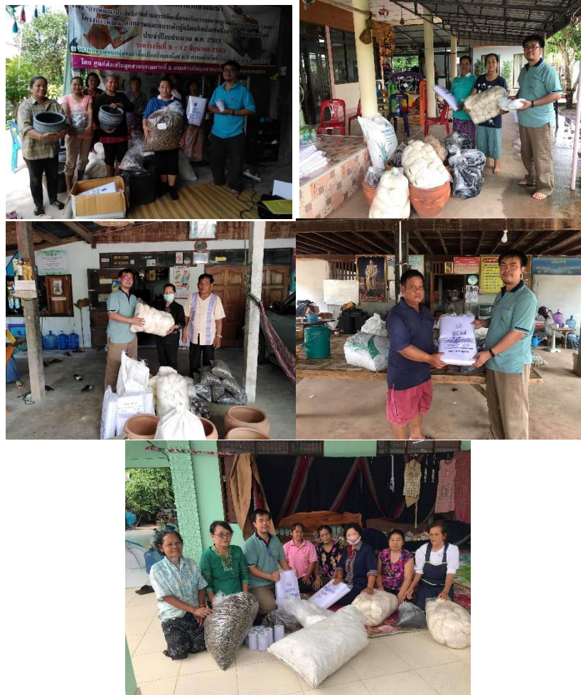
ภาพที่ 3 มอบวัสดุเพื่อให้วิสาหกิจชุมชนดำเนินการ