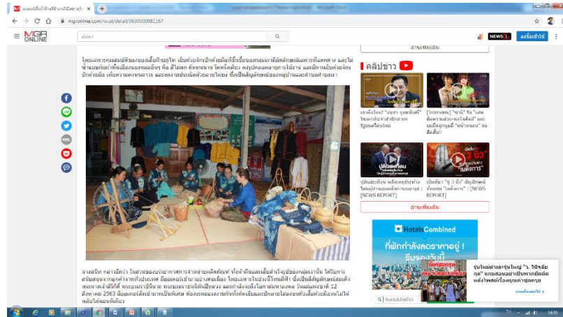
ภาพที่ 6 ภาพข่าวช่องทางการจำหน่ายของกลุ่ม