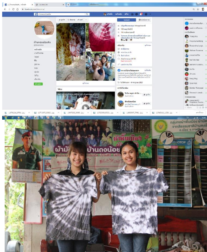
ภาพที่ 5 ช่องทางการจำหน่ายของกลุ่ม

4.1 วิสาหกิจชุมชนกลุ่มทอผ้าพื้นเมืองบ้านดงน้อย ม.3 จัดทำแฟนเพจเฟซบุ๊กและพัฒนาแหล่งผลิตเพื่อเผยแพร่ความรู้ และจำหน่ายสินค้าของกลุ่ม