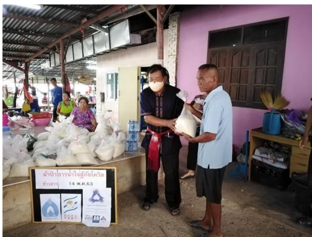
ภาพที่ 9 ผ้าป่าข้าวสารและอาหารแห้ง เพื่อนำไปช่วยเหลือชุมชนที่ได้รับผลกระทบจากโควิด 19

โครงการร่วมกับวิสาหกิจชุมชนกลุ่มทอผ้าพื้นเมืองบ้านดงน้อย ม.3 จัดกิจกรรมเพื่อสังคม ด้วยการระดมผ้าป่าข้าวสารและอาหารแห้งภายในชุมชนและจากเครือข่าย เพื่อนำไปช่วยเหลือชุมชนที่ได้รับผลกระทบจากโควิด 19 จำนวน 60 กว่าครัวเรือน ที่บ้านทับปลา ต.หนองสรวง อ.หนองกุงศรี จ.กาฬสินธุ์ (บริจาคข้าวสาร 340 กก.) ส่งผลให้กลุ่มมีความสัมพันธ์ที่ตึ่มากขึ้น และ มีความสุขทางจิตใจมากขึ้นที่ได้ช่วยเหลือผู้อื่น