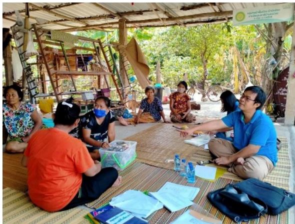
ภาพที่ 10 ประชุมเรื่องกองทุนกลุ่ม

2. วิสาหกิจชุมชนเสื่อเย็บด้วยจักร ปักด้วยมือ กลุ่มสตรีคำบง ปัจจุบันมีเงินทุนหมุนเวียน ประมาณ 2 หมื่นกว่าบาท