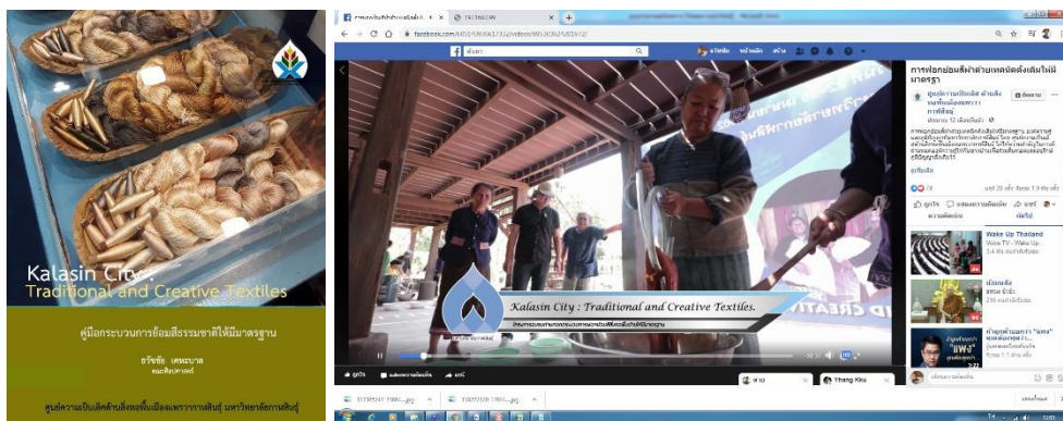
ภาพที่ 2 สื่อการเรียนรู้ที่แนะนำให้กลุ่มนำไปใช้พัฒนาผลิตภัณฑ์ กิจกรรมที่ 6 พัฒนาและยกระดับการจัดการผลิตภัณฑ์ผ้าทอพื้นเมืองย้อมสีธรรมชาติในชุมชนให้ สอดคล้องกับความต้องการของตลาด แก่ชุมชนเป้าหมายและชุมชนเครือข่าย มีการดำเนินงานดังนี้