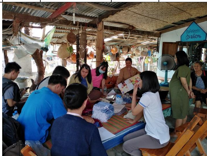
ภาพที่ 1 ประเมินและวางแผนยกระดับคุณภาพชีวิตแบบองค์รวม ในชุมชนเป้าหมายหลัก

กิจกรรมที่ 2 ศึกษาดูงานชุมชนต้นแบบด้านยกระดับรายได้และคุณภาพชีวิตของชุมชนด้านผ้าทอพื้นเมืองย้อมสีธรรมชาติ