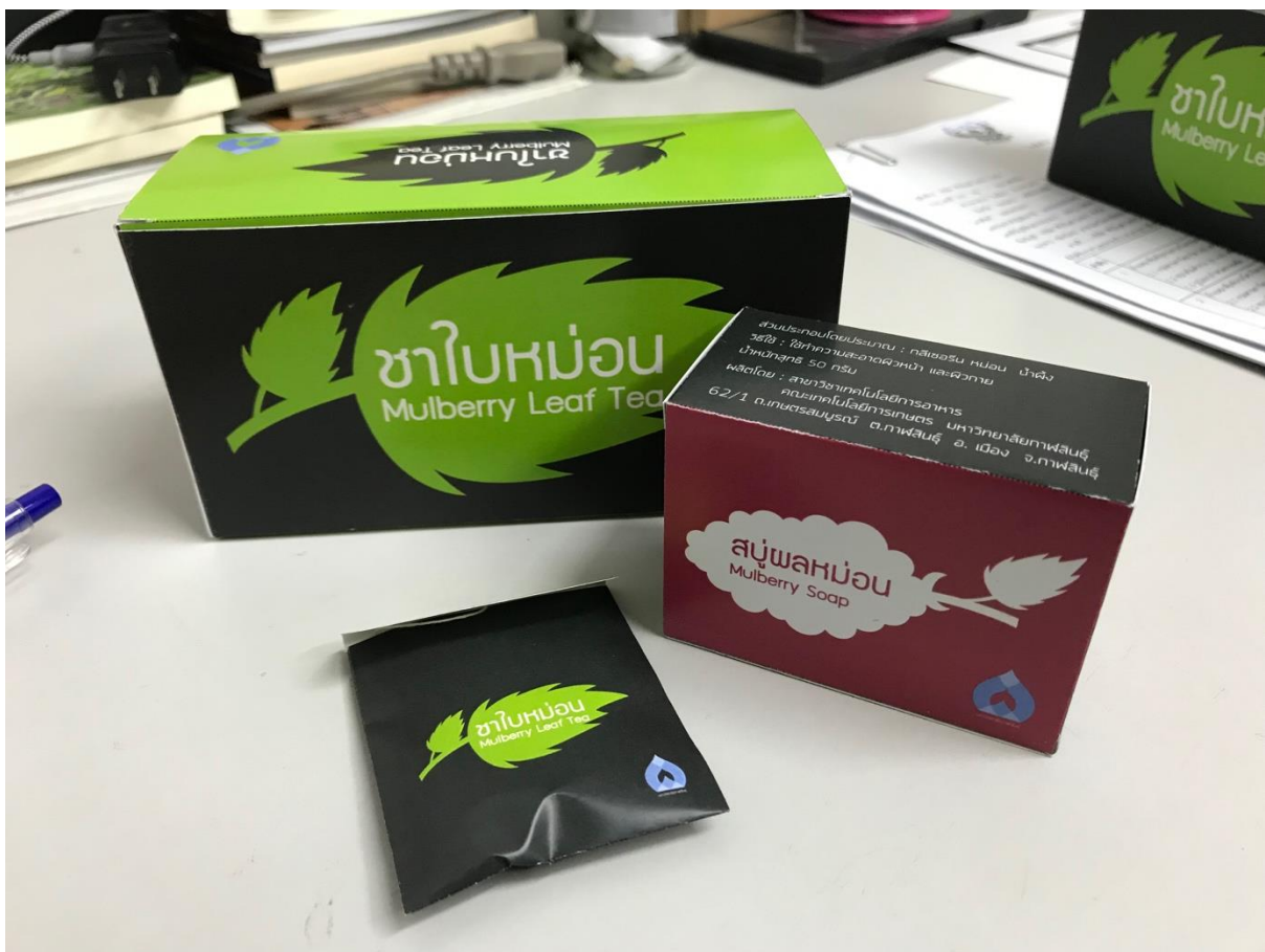
ภาพที่ 7 กล่องบรรจุภัณฑ์ ชาใบหม่อน และ สบู่ผลหม่อน