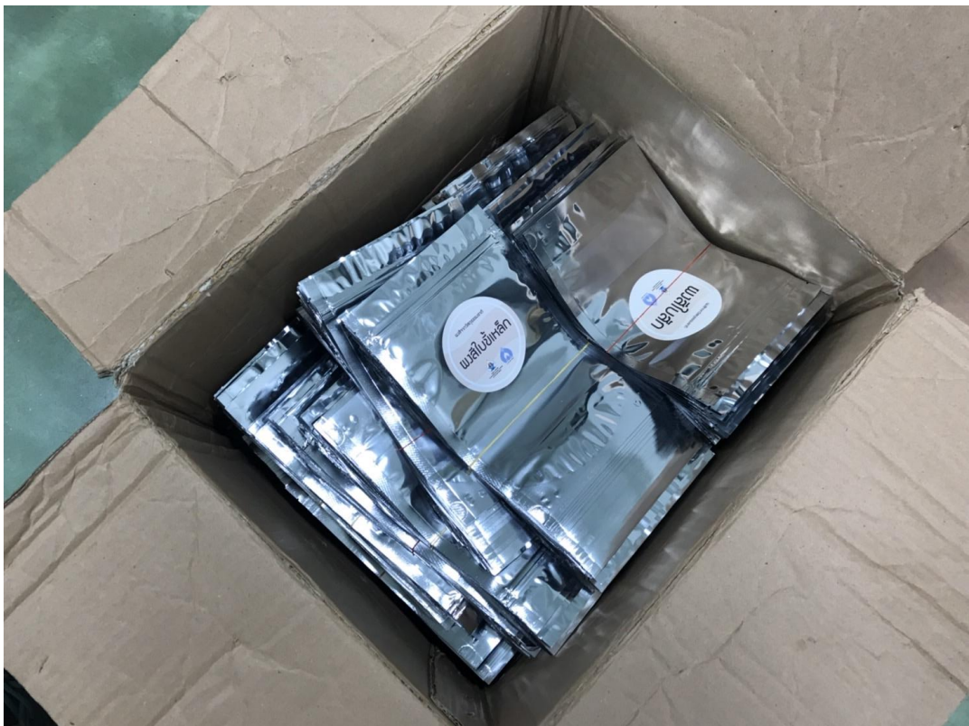
ภาพที่ 13 บรรจุภัณฑ์ซองผงสีธรรมชาติ