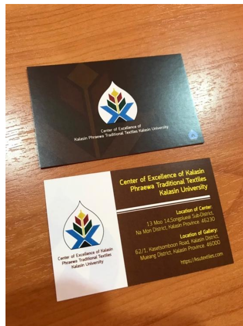
ภาพที่ 3 Hangtag และนามบัตร ศูนย์ผ้าทอพื้นเมืองแพรวากาฬสินธุ์ กิจกรรมการตลาดในประเทศ และ ต่างประเทศ