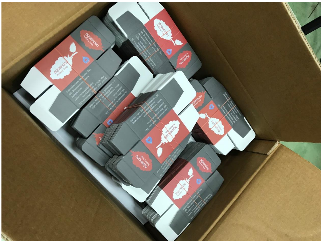
ภาพที่ 9 กล่องบรรจุภัณฑ์ สบู่ผลหม่อน