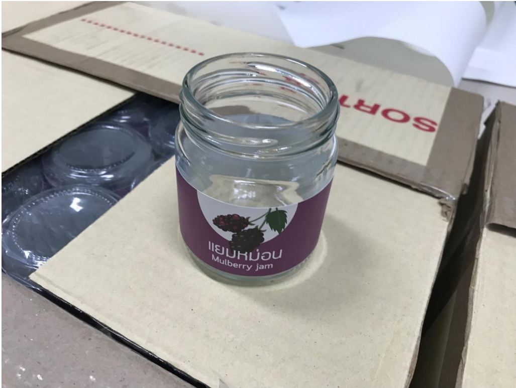
ภาพที่ 10 บรรจุภัณฑ์ขวดแยมหม่อน