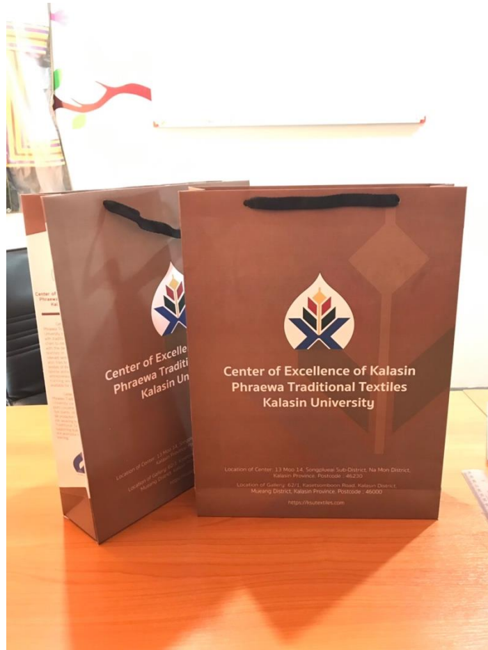
ภาพที่ 2 ถุงศูนย์ผ้าทอพื้นเมืองแพรวากาฬสินธุ์ กิจกรรมการตลาดในประเทศ และ ต่างประเทศ