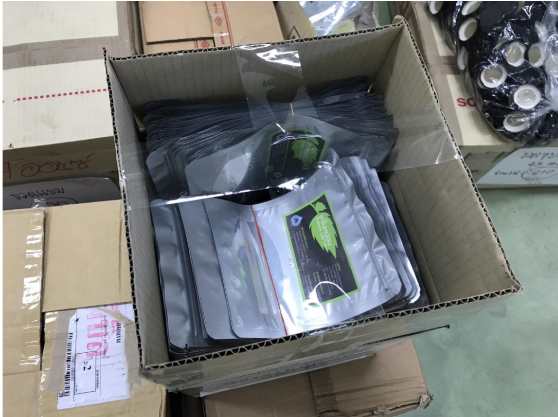
ภาพที่ 14 บรรจุภัณฑ์ซองชาผงหม่อน