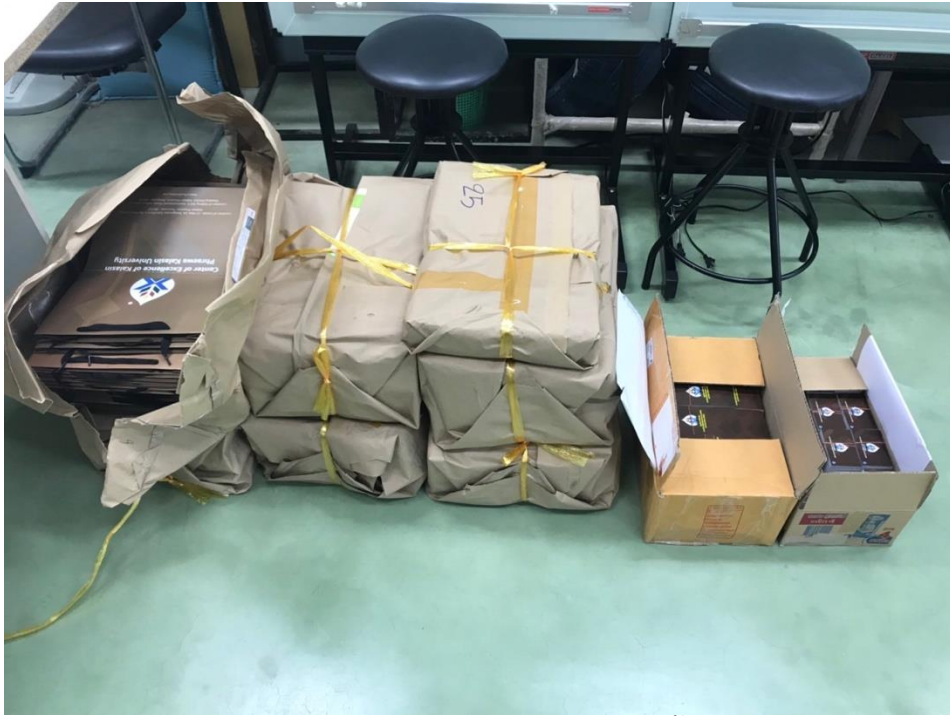
ภาพที่ 4 ถุง ป้าย Hangtag และ นามบัตร ศูนย์ผ้าทอพื้นเมืองแพรวากาฬสินธุ์ กิจกรรมการตลาดในประเทศ และ ต่างประเทศ