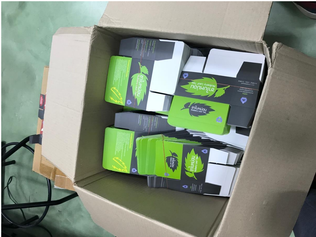
ภาพที่ 8 กล่องบรรจุภัณฑ์ ชาใบหม่อน