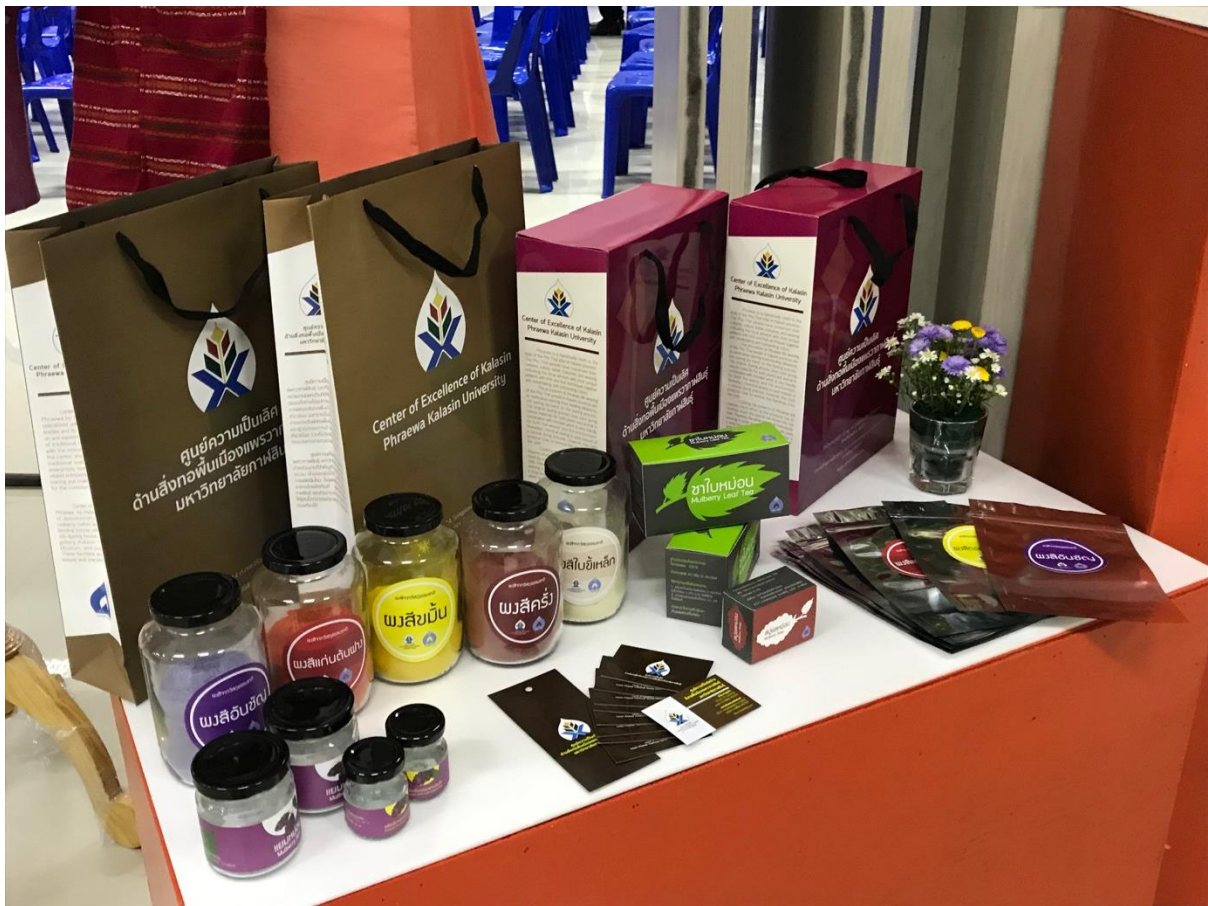
ภาพที่ 1 ตัวอย่างบรรจุภัณฑ์ทั้งหมดจากโครงการ