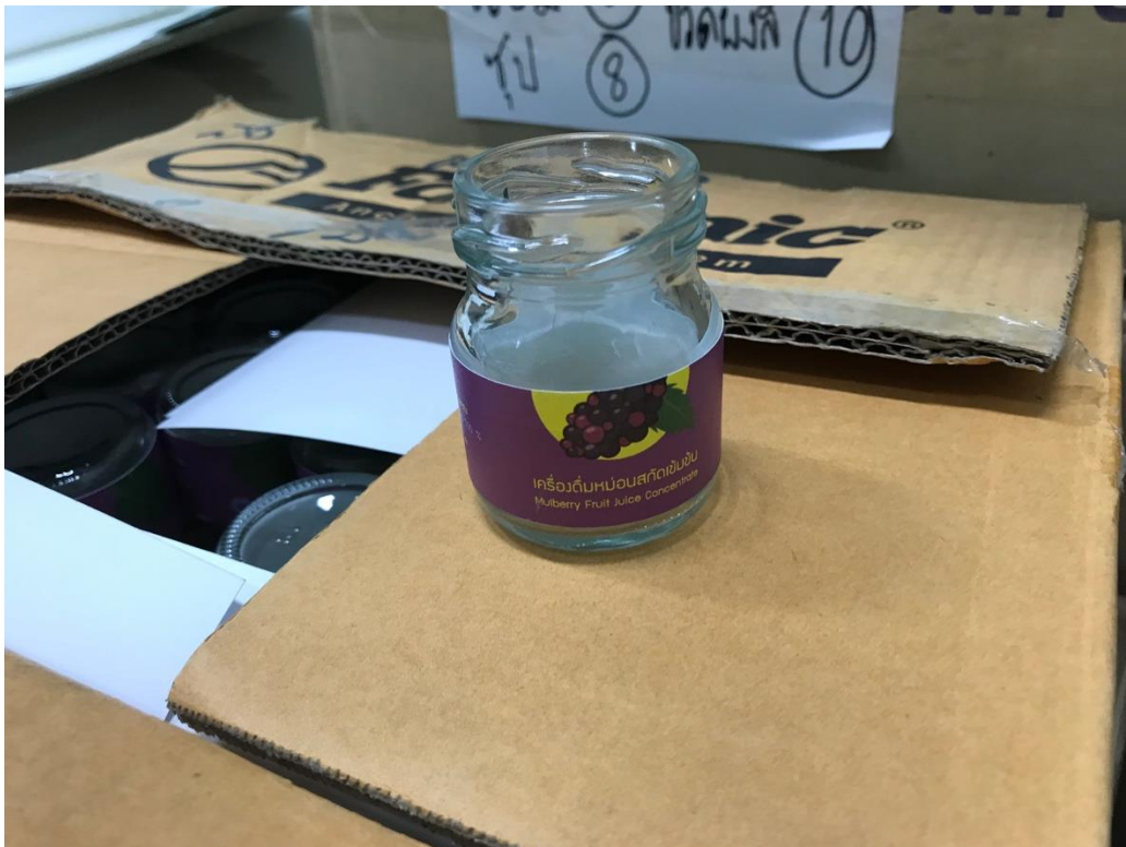
ภาพที่ 11 บรรจุภัณฑ์ขวดซุพหม่อน