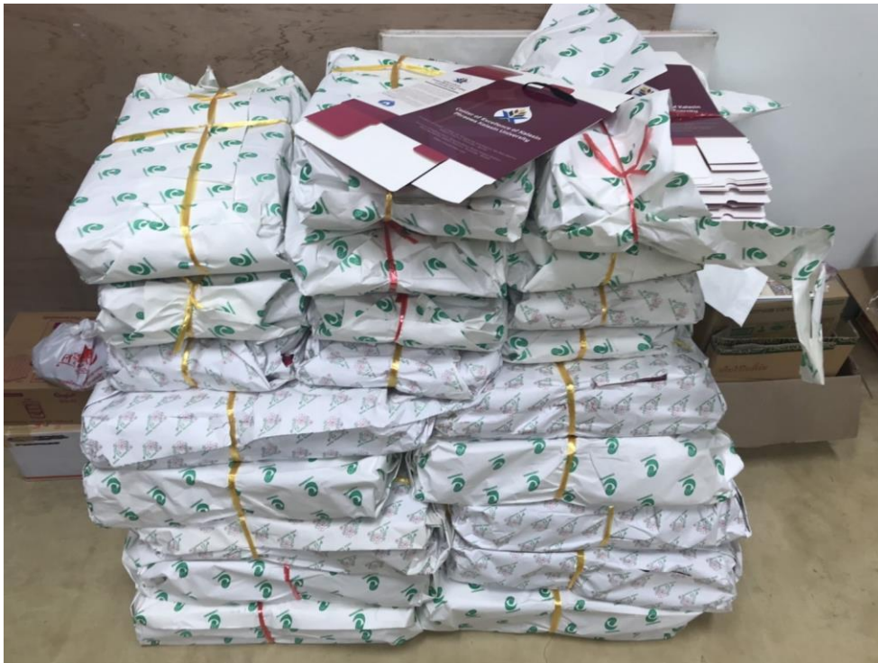
ภาพที่ 6 กล่องบรรจุภัณฑ์ ผ้าแพรวา ศูนย์ผ้าทอพื้นเมืองแพรวากาฬสินธุ์