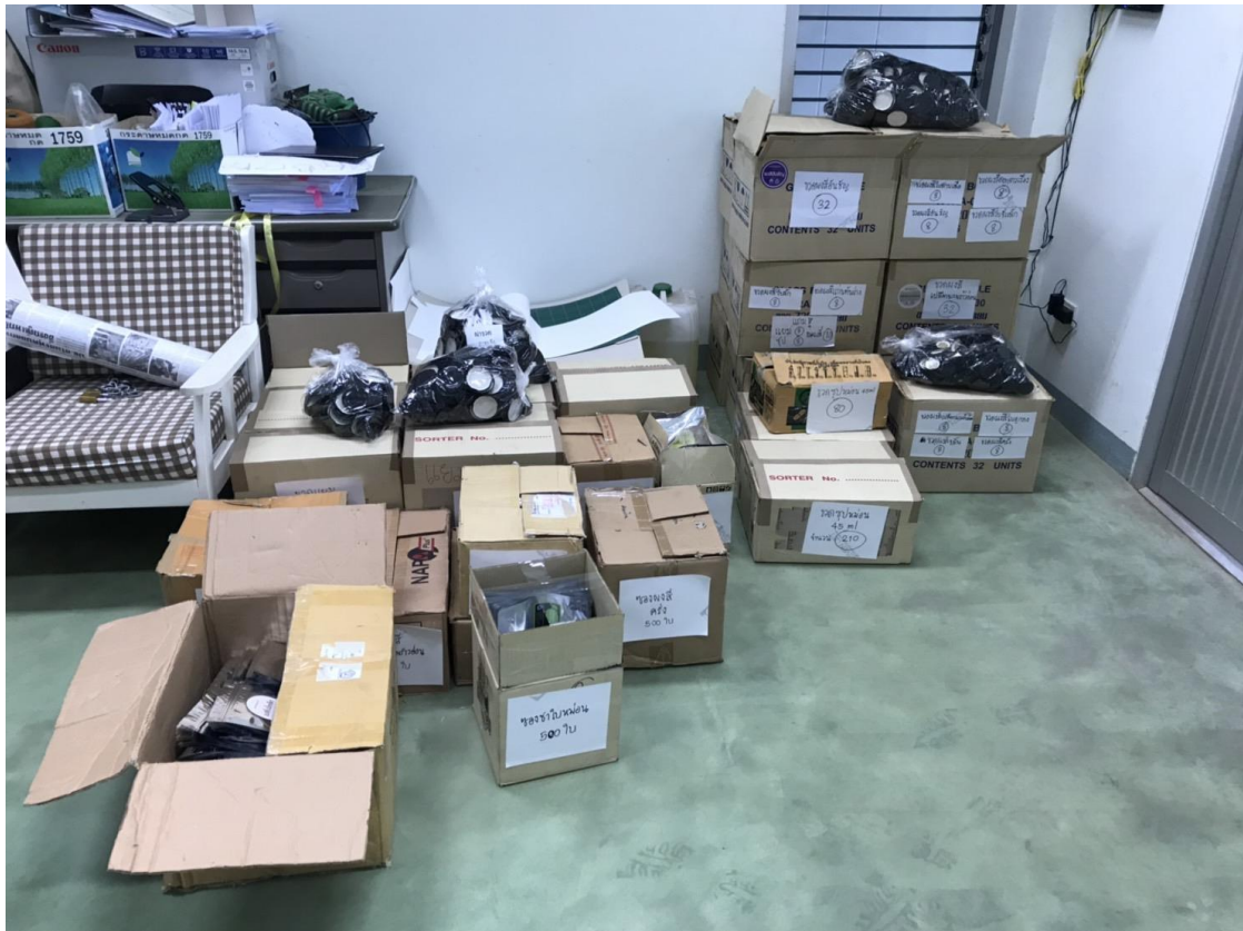
ภาพที่ 15 บรรจุภัณฑ์ ขวดแยมหม่อน ขวดซูปหม่อน ขวดผงสีธรรมชาติ ซองผงสีธรรมชาติ ซองชาผงหม่อน