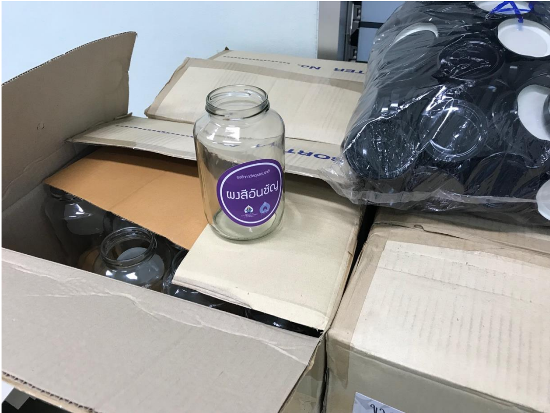
ภาพที่ 12 บรรจุภัณฑ์ขวดผงสีธรรมชาติ