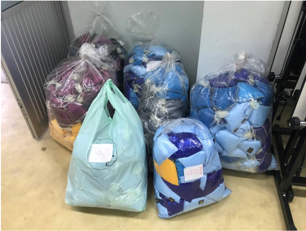
ภาพที่ 16 หมอนวางโทรศัพท์