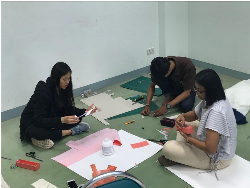
ภาพที่ 7 บรรยายการอบรม 7