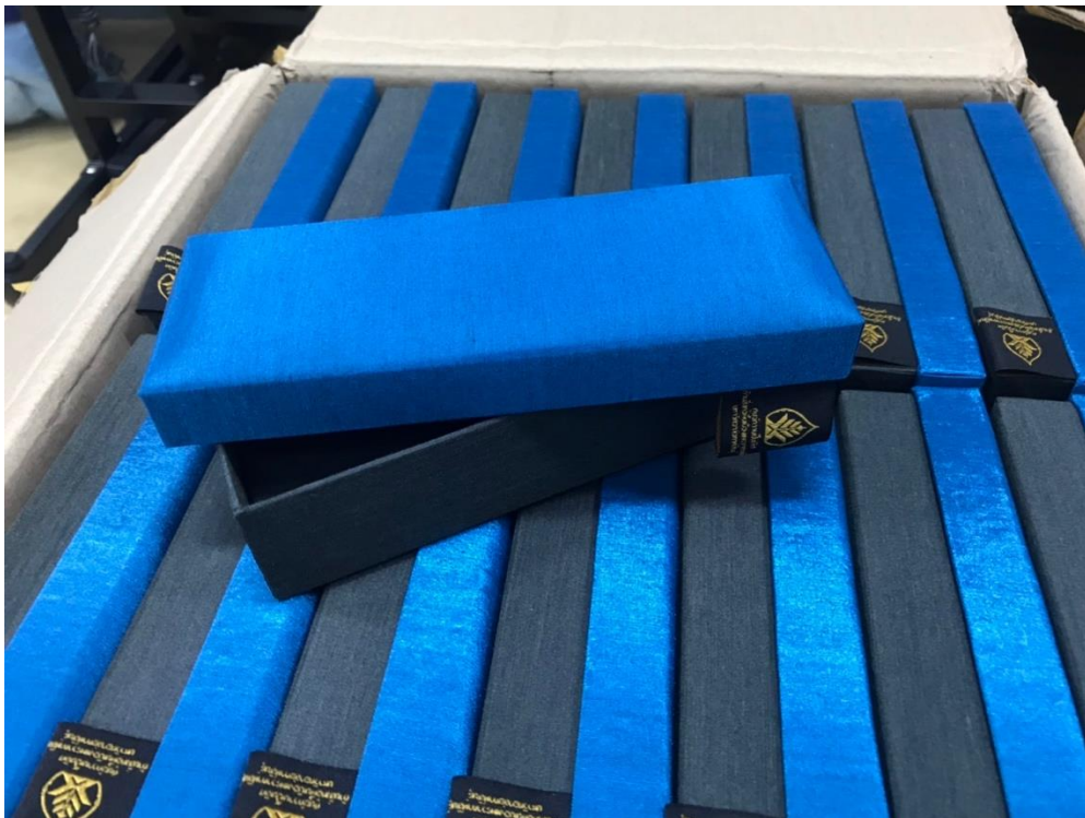
ภาพที่ 17 กล่องใส่ปากกา