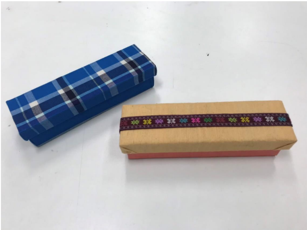
ภาพที่ 15 ต้นแบบกล่องใส่ปากกา