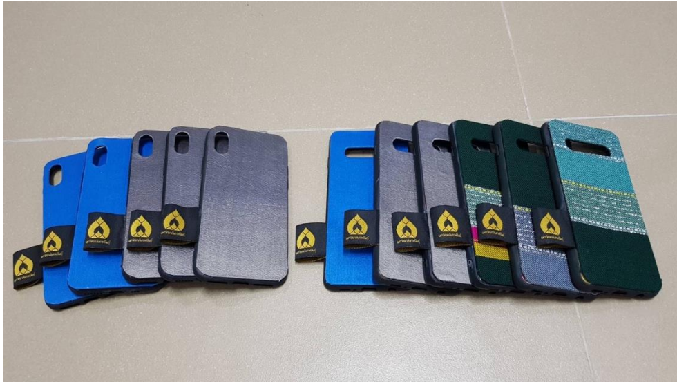
ภาพที่ 20 กรอบใส่โทรศัพท์มือถือ