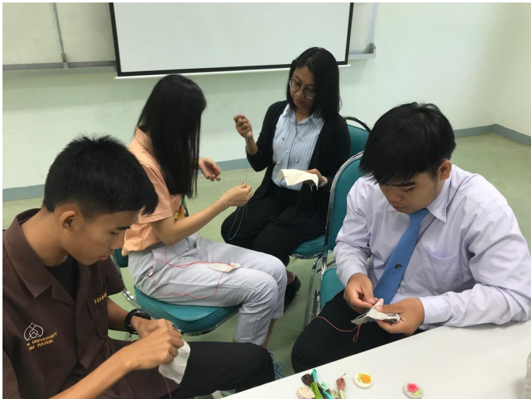
ภาพที่ 3 บรรยายภาพการอบรม 3