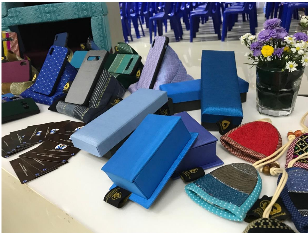
ภาพที่ 21 ภาพบรรจุภัณฑ์ของที่ระลึก ศูนย์ผ้าทอพื้นเมืองแพรวากาฬสินธุ์