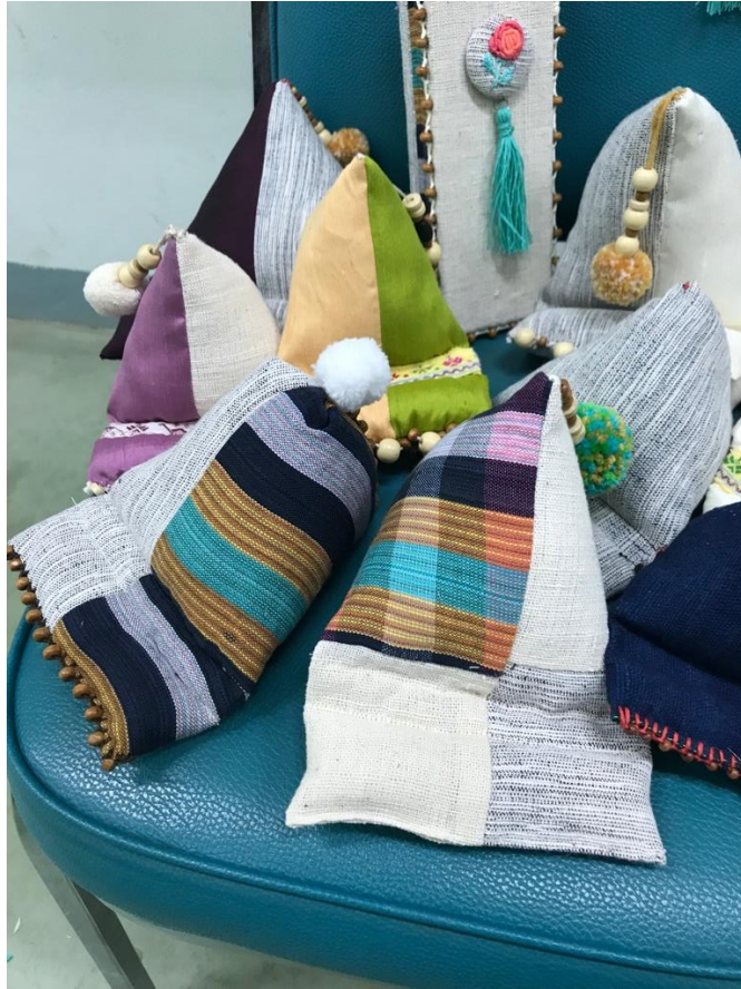
ภาพที่ 10 บรรยากาศการอบรม 10