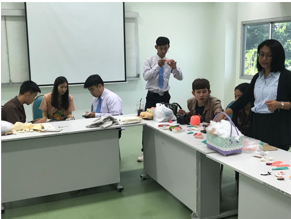
ภาพที่ 1 บรรยากาศการอบรม 1