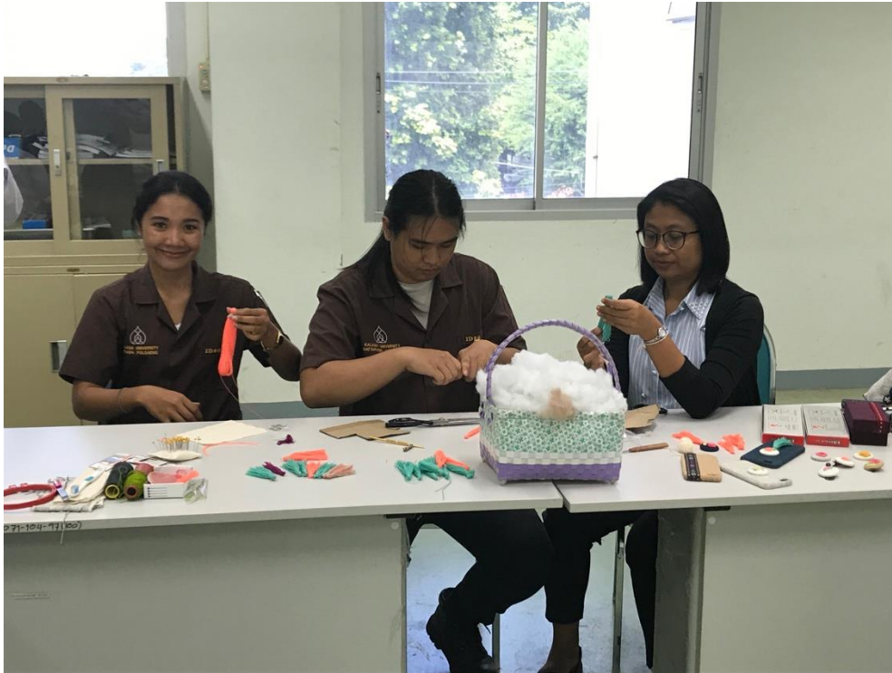
ภาพที่ 2 บรรยายภาพการอบรม 2