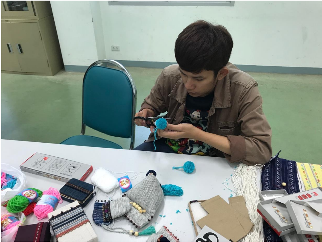
ภาพที่ 4 บรรยายภาคการอบรม 4