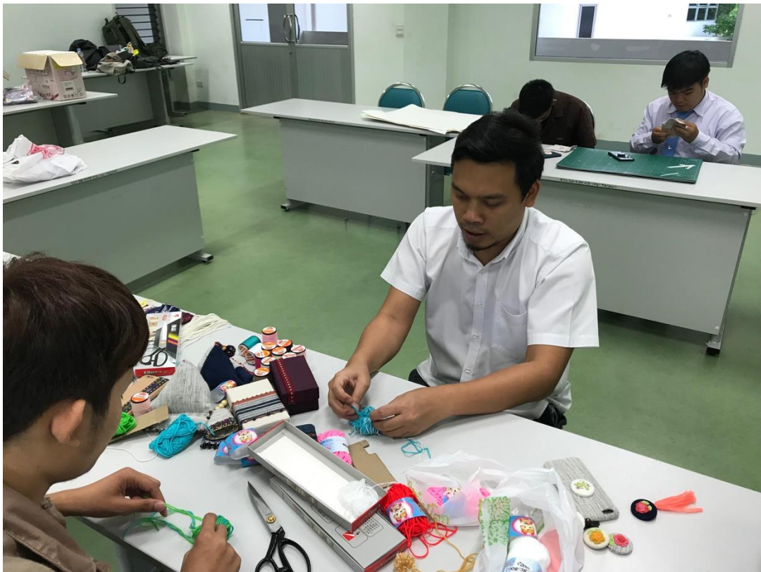
ภาพที่ 5 บรรยายภาคการอบรม 5