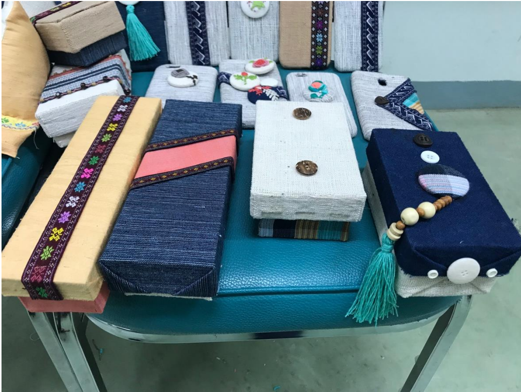
ภาพที่ 8 บรรยากาศการอบรม 8