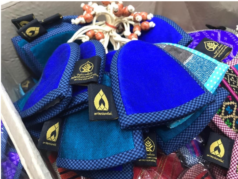
ภาพที่ 19 กระเป๋าพวงกุญแจ