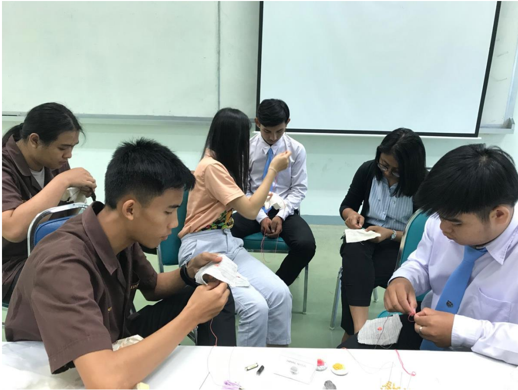
ภาพที่ 6 บรรยายการอบรม 6