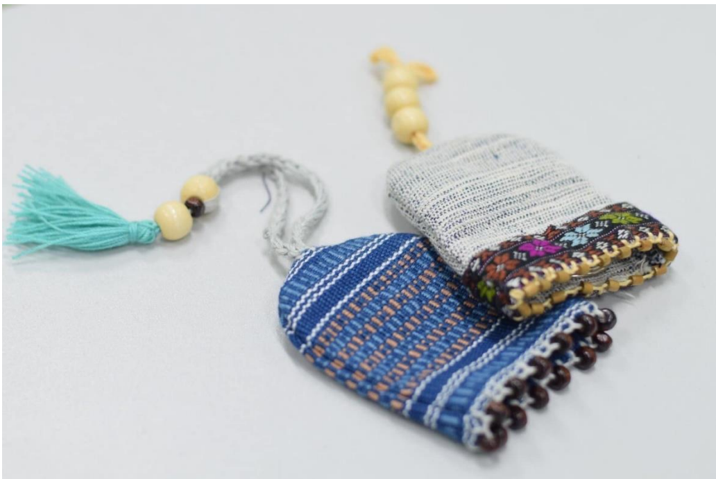
ภาพที่ 13 ต้นแบบกระเป๋าพวงกุญแจ