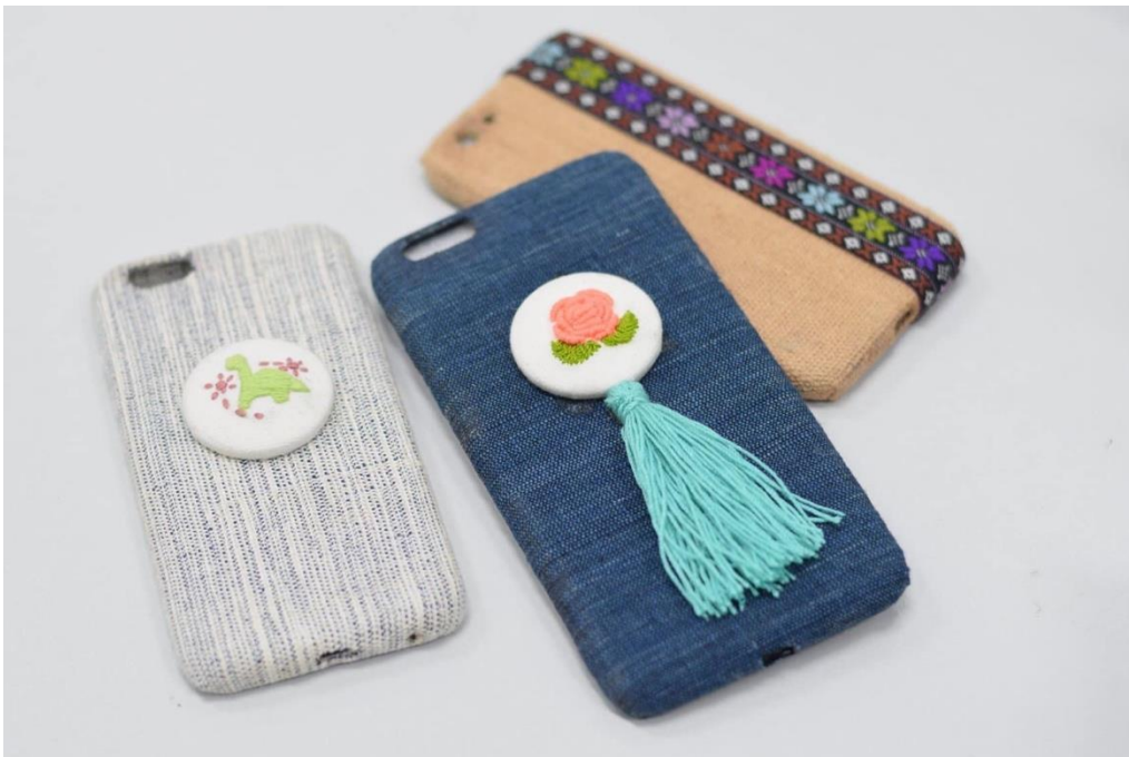
ภาพที่ 11 ต้นแบบกรอบโทรศัพท์