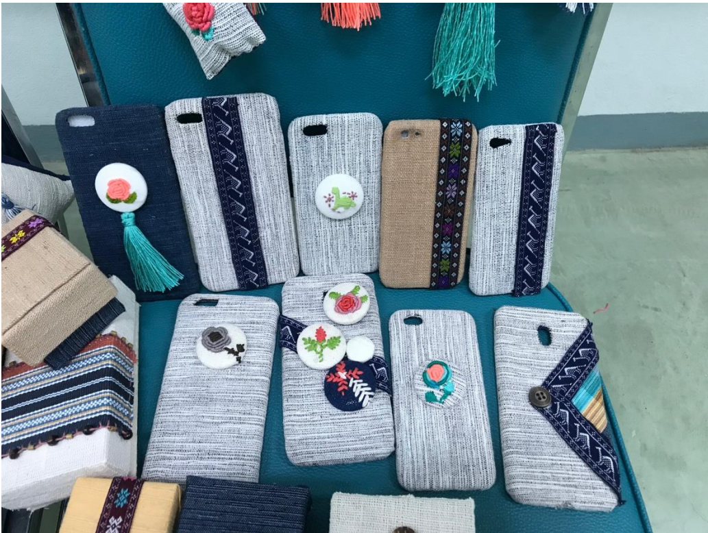
ภาพที่ 9 บรรยากาศการอบรม 9