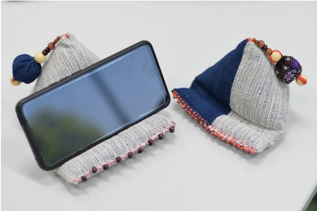
ภาพที่ 12 ต้นแบบหมอนวางโทรศัพท์มือถือ